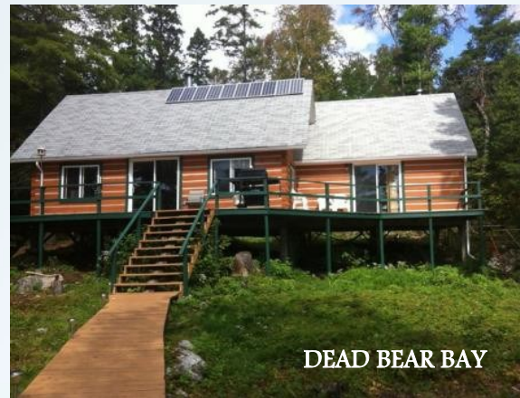
DEAD BEAR BAY

All of our outpost cottages are fully equipped with electric fridges and grid or solar power.