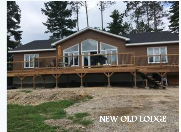
NEW OLD LODGE